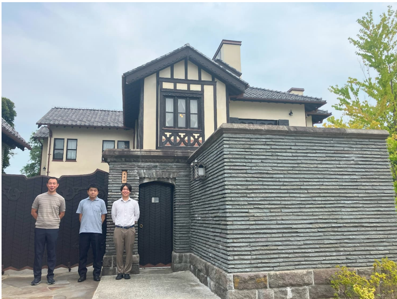
② 甚吉邸 (国登録有形文化財)